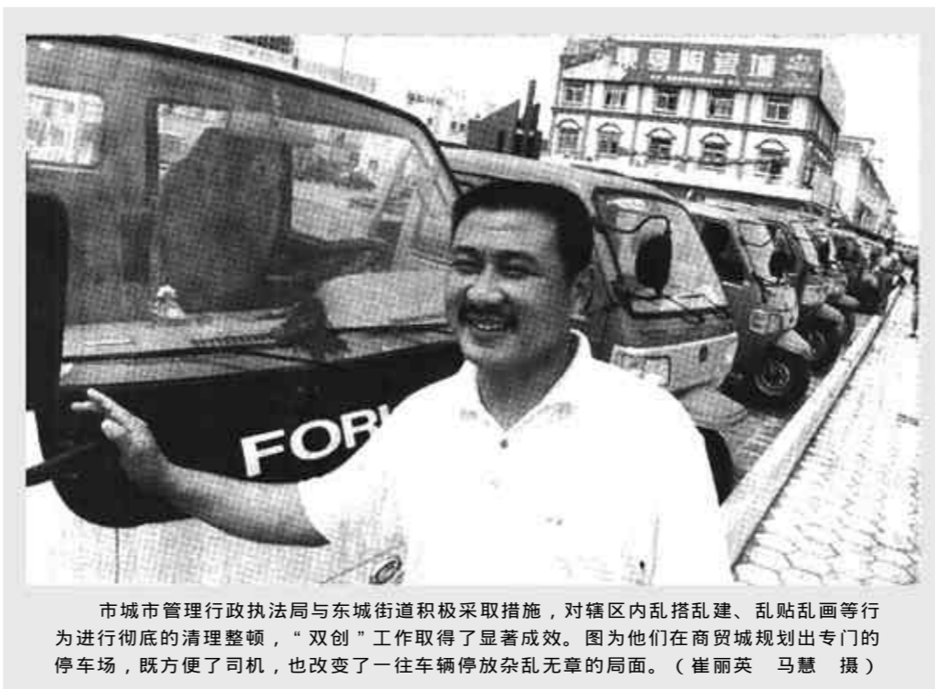
市城市管理行政执法局与东城街道积极采取措施,对辖区内乱搭乱建、乱贴乱画等进行彻底的清理整顿,“双创”工作取得了显著成效。图为他们在商贸城规划出专门的停车场,既方便了司机,也改变了一往车辆停放杂乱无章的局面。

这个街道还充分发挥协管员在安全生产中的协管作用,采取多种措施筑牢安全生产第二道防线,不断组织文艺骨干到企业慰问演出自编自演的安全生产小节目,充实职工的业余文化生活,发放安全生产宣传画、慰问信等。上半年,这个街道走访企业34家,签订安全生产责任状34份,有效地促进了安全生产工作的顺利开展。(王润身 盖增军)