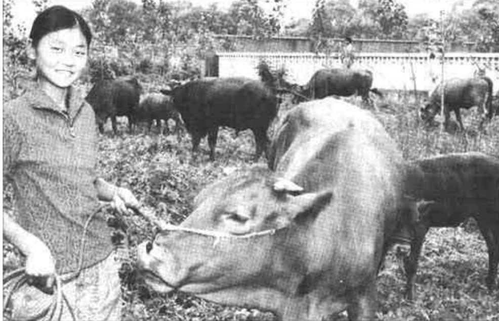
7月17日，安徽省淮南市的一位小姑娘在帮助家里放牛。泥河洼地除涝工程的实施改善了这一地区群众生活和农业生产条件，原来的内涝区如今成了水草茂盛的牧区。当地积极建设泥河洼地除涝工程，并于2002年7月建成投入使用。改善了70万亩可耕农田的生产条件，也使淮南煤矿和平圩电厂免受洪水威胁。

学习贯彻“三个代表”重要思想，必须紧密联系各级组织和党员干部队伍的实际，以改革的精神推进党的建设。贯彻“三个代表”重要思想，必须以改革的精神推进党的建设，不断为党的肌体注入新活力。要进一步用“三个代表”重要思想武装党员干部的头脑，不断增强党员干部实践“三个代表”重要思想的自觉性和坚定性。要着力加强党的