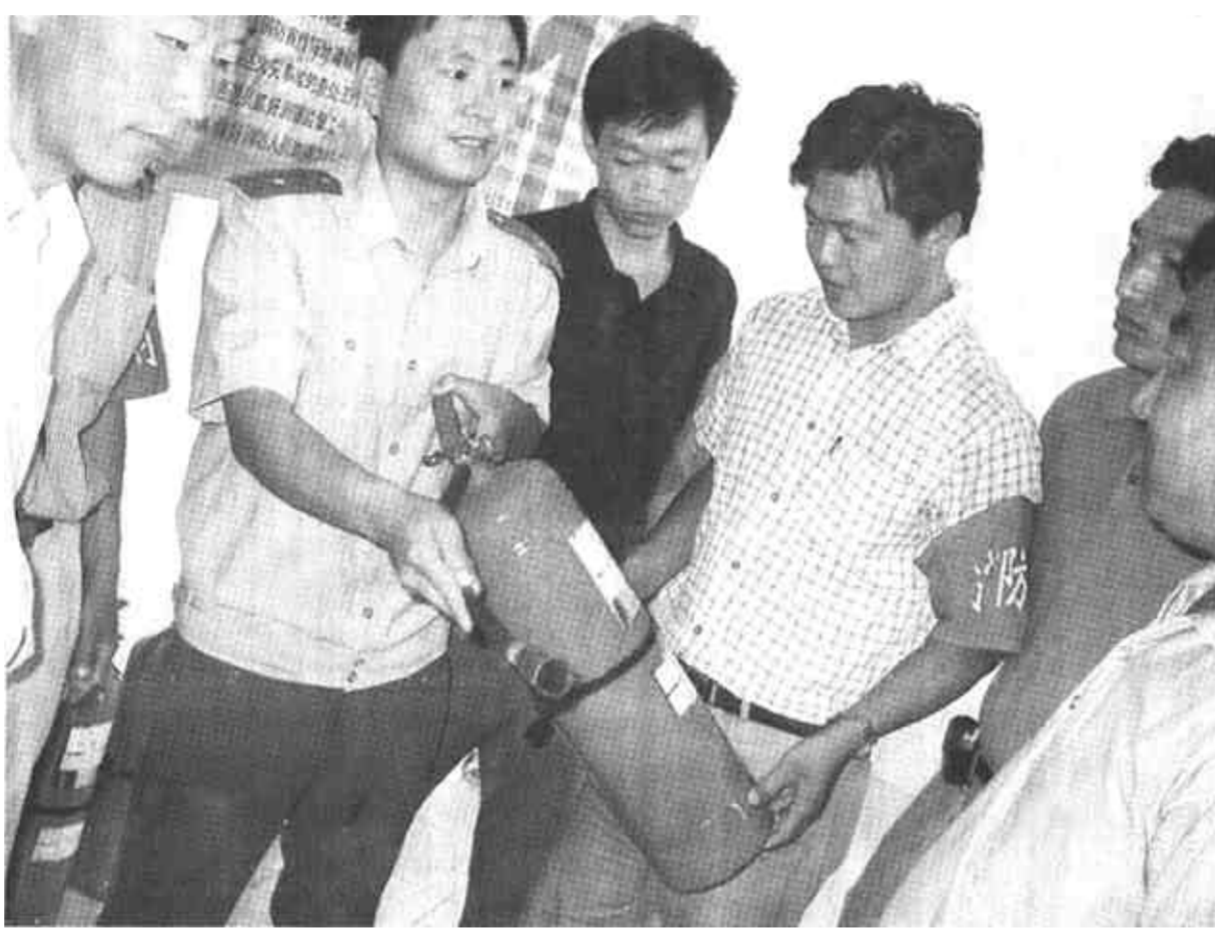
近日,垦利县胜坨镇工农村成立了义务消防队,队员有30名群众组成,主要负责该村突发火灾的初期灭火工作和向群众普及基本的消防常识。图为该村村民义务消防队员在县公安局消防大队指导下进行基本功训练演习。

按照最高人民法院及山东省高院有关规定,利津县人民法院实行了司法鉴定归口管理,法官不再享有选择鉴定机构的权力。